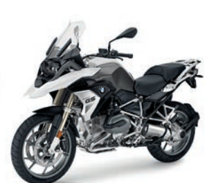
R 1200 GS