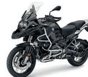
R 1200 GS Adventure

Zudem bieten wir für Anfänger auch leistungsreduzierte Modelle. Alle Motorräder, außer die BMW F 800 GS Adventure, stehen auch als tiefergelegte Versionen zur Verfügung. Oder du kommst direkt mit deinem eigenen Motorrad und lernst, es noch besser zu beherrschen. (Die Voraussetzungen für ein Training mit dem eigenen Motorrad findest du auf der nächsten Seite.)