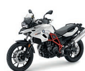
F 700 GS

Adrenalin-Kick. Nicht nur das große Gelände mit seinen verschiedenen Übungssektionen, auch die modernen Gebäude mit komfortablen Bewirtungs- und Umkleideräumen lassen keine Wünsche offen. Freu dich schon jetzt auf unsere exzellenten Kurse und unsere Maschinen. Folgende Modelle von BMW Motorrad kommen bei uns zum Einsatz: