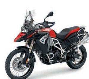
F 800 GS Adventure