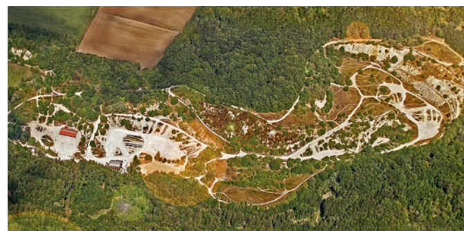
26 Hektar kompromissloser Fahrspaß.

Mit staubigen Grüßen dein Team vom Enduro Park Hechlingen