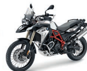
F 800 GS